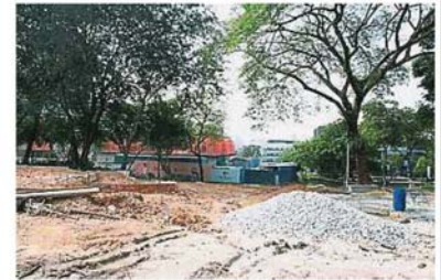
因建设运动设施，所以灵市17区住宅附近的树木也遭大量砍伐。

民造成困扰，尤其是近期的天气反复无常，炎热的午后也有可能突然下起大雨，若泥土松软的话，恐怕会造成土崩的情况发生。