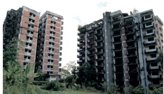
Kerja perobohan bangunan Highland Towers dijangka dibuat Jun ini bagi memberi laluan kepada pembangunan semula kawasan terbabit.

"Saya tiada maklumat terus dari KPKT berhubung perkara ini tapi kebiasaannya dalam projek-projek pemba-