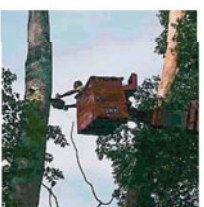
根據最新的消息指出，市政局已于本月8日派人砍伐復發可危的樹木。