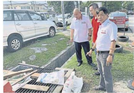
成的铁盖工程。 黎淮褙（中）视察其中一个已完

他说，除了以上 2 个地点，小型工程还包括 Bunga Kemboja 11 路的楼梯、Bunga