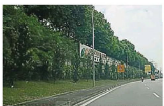
高聳的斜坡樹木突然倒下，不偏不倚擊中在大道上行駛中的摩多車騎士，所幸騎士沒有性命危險，只是蒙受輕傷。