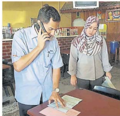
执法人员正检查餐饮业者提供的门牌税缴付单据。

“市政厅为了进一步降低拖欠率, 也延续过去一直进行的上门追讨方式, 于 2 月开始陆续在莎阿南区开展门牌税充公取缔行动 (Operasi Sita Cukai Taksiran)。”