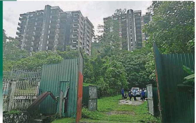
大批安邦再也市議會官員進入淡江高峰塔展開實地調查，惟他們不願透露視察是否與拆除公寓樓宇及開闢休閒公園計劃有關。

有關公寓是於1993年12月11日發生建築物倒塌事件，導致48人罹難，迄今已廢置26年。房屋及地方政府部長祖萊達日前宣布，有關公寓的拆除工作最遲於今年6月完成，拆除工程由安邦市議會及公共工程局執行，並計劃將不適合建設住宅區的地段，開闢成休閒公園。