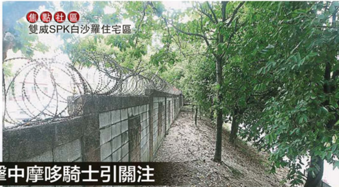
屬於雙威SPK白沙羅住宅區圍牆外與白蘭大道緩沖地帶的斜坡地，88棵樹木，沿著約600公尺的斜坡栽種，其中較茂密及危及較茂密的樹木是長在約有400公尺長山坡上。