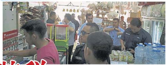
执法人员前往拖欠门牌税的杂货店, 向业者追讨税务。

(莎阿南 12 日讯) 莎阿南市政厅 2017 年推行电子绑定 (i-SEKAT) 系统后, 门牌税收逐年增长, 2018 年更达至 90% 收税率。如今, 市政厅放眼再通过充公取缔行动追讨, 以把欠税率降至最低水平。