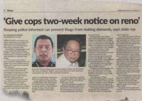
StarMetro's report on Feb 4.