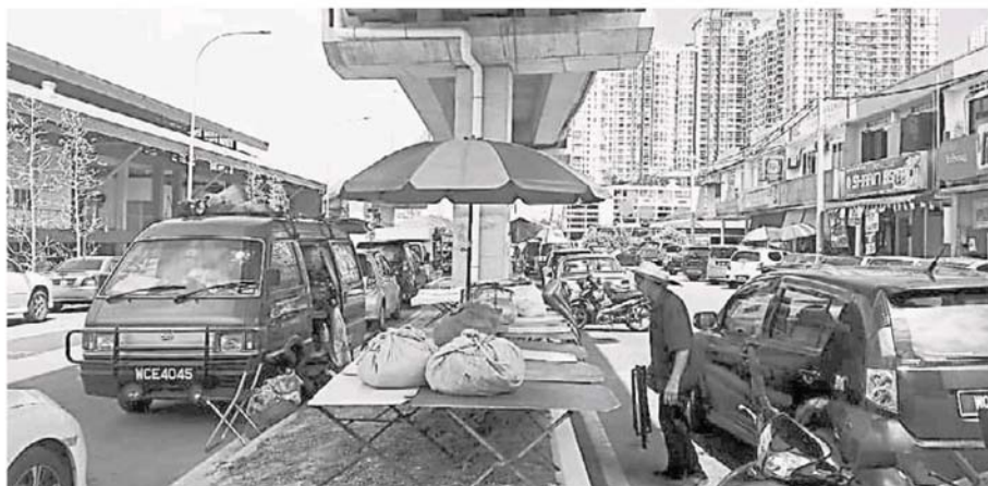
天桥底下马路分界堤的空地，成为早市小贩的临时开档地点。

新的交通系统也未正式开跑，天桥底下的交通还可控制，只是在巴刹交通灯前，因绿灯时限只有 8 秒，天桥底下的车辆来不及疏通，才出现交通堵塞，希望作出调整。