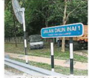
圍牆外就是白蘭大道（往白沙羅和八打尼再往北方向），但樹木長得非常茂密和接近，因此市政局將在近期內派人修剪。

Provided for client's internal research purposes only. May not be further copied, distributed, sold or published in any form without the prior consent of the copyright owner.