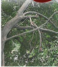
一些樹木的枝椏明顯斷裂了，隨時有往下掉和滾下山坡的危險。

所幸當時只是摩多車前毀壞，人無大礙，惟此事已引起吉隆坡市政局與大道公司的高度關注，各造將在近期內聯合展開修剪樹木枝椏的工作，并有可能在施工期間封鎖部分鄰近斜坡一帶的路段。 上述意外事故，都突然倒下的樹木，是栽種于達英乃晶格路（Jalan Dam Inai