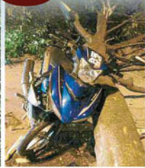
被樹干打中，摩多車的車頭已經嚴重損壞。